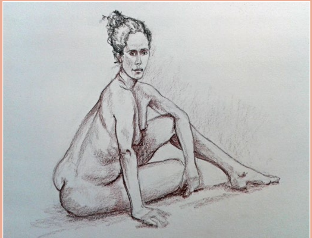
Modeltekenen 11 maart 2015 Het resultaat van een 2x een half uur.